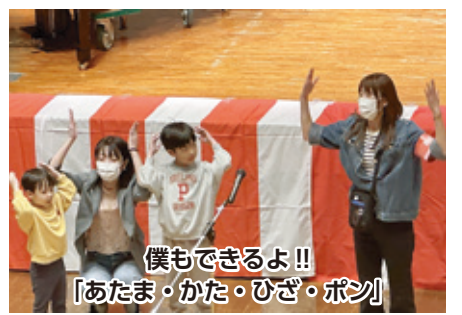
僕もできるよ!! 「あたま・かた・ひざ・ボン」