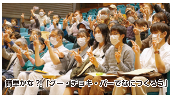
簡単な? 「グー・チョキ・パーでなにつくろう」