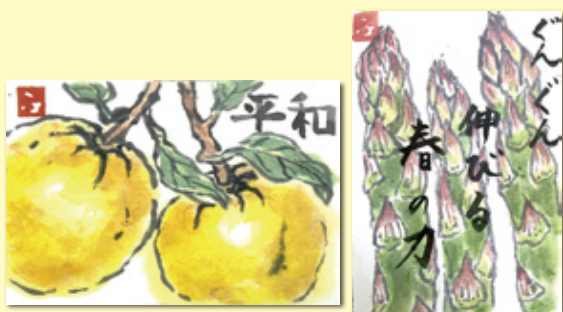
絵手紙 船橋市二和東 柏木文代