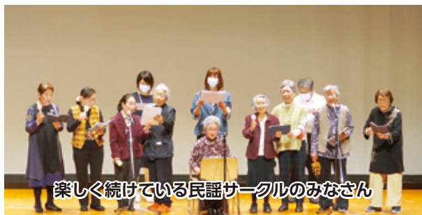
楽しく続けている民謡サークルのみなさん