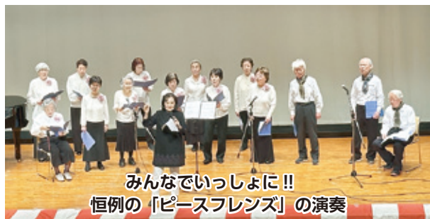
みんなでいっしょに!! 恒例の「ピースフレンズ」の演奏