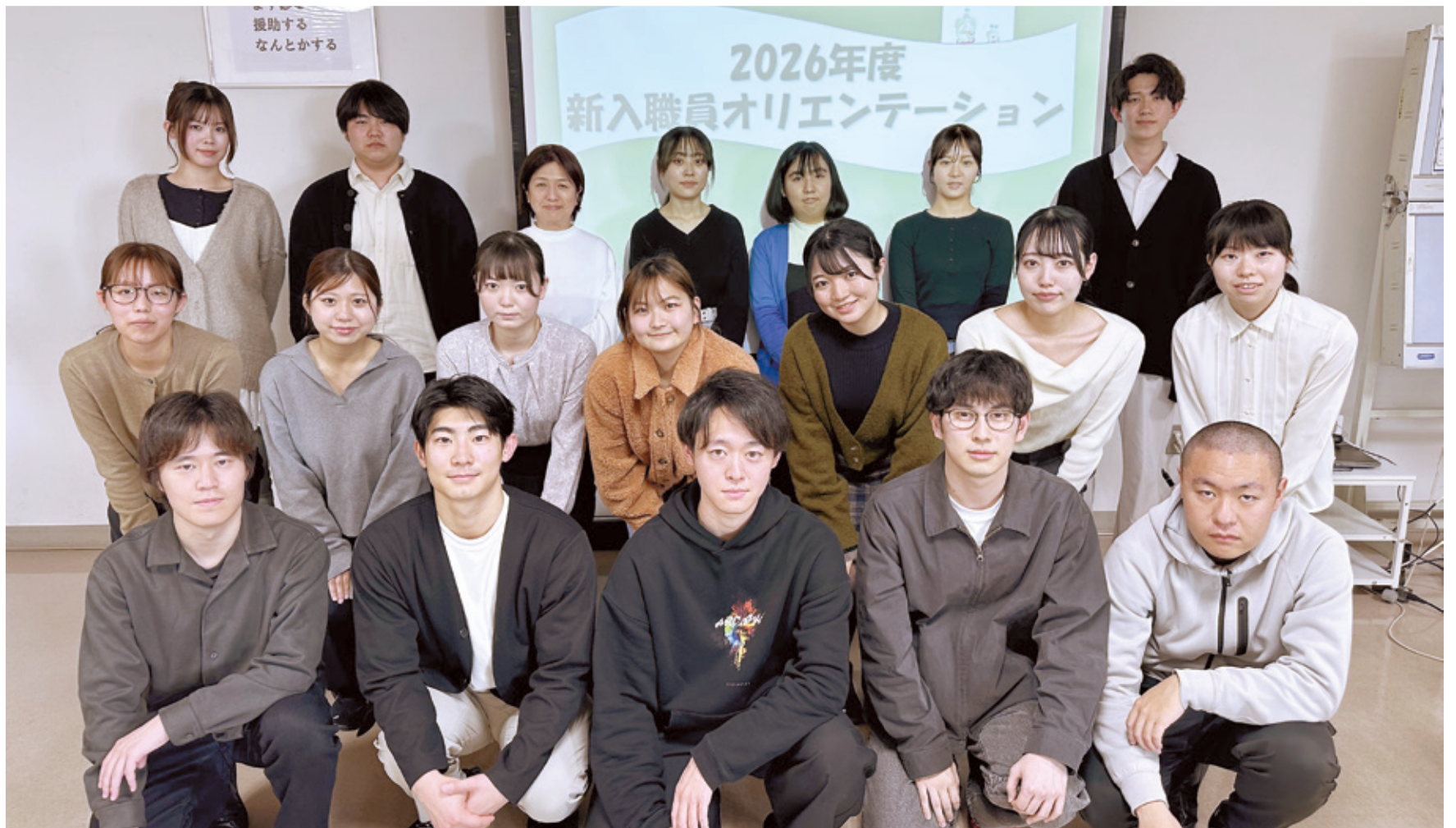
(初期研修医 5名、助産師 1名、看護師 5名、理学療法士 3名、作業療法士 2名、言語聴覚士 1名、臨床工学技士 1名、社会福祉士 1名、事務 1名)