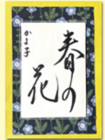
鎌ヶ谷市馬込沢 ペン字 今野加代子