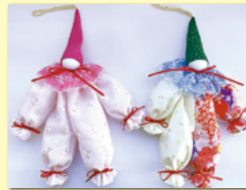
大穴・三咲地区 手芸 手作り企画作品