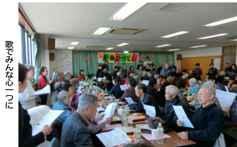
歌でみんな心一つに

2月24日(土)、2018年「新春のつどい」が開催されました。友の会151名、来賓6名、職員29名の186名の参加で盛大に行われました。