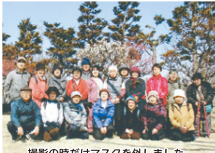
撮影の時だけマスクを外しました

2月のウォーキングが2月27日(日)に行われ、久しぶりの春らしい陽気に誘われ19名が参加しました。例年ですと成田山公園の大きな梅林の中で、梅の香に包まれながら「津軽民謡」の催しを楽しみ英気を養うところが、「新型コロナウイルス」の感染爆発により、船橋市でも連日の