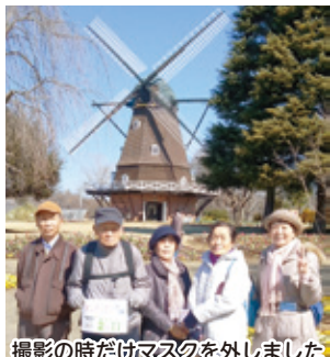
撮影の時だけマスクを外しました

2月22日(火)にアンデルセン公園に5人で行ってきました。梅やスイセンがきれいに咲いていました。春の曲の歌集を用意し、「花」「早春賦」「北国の春」