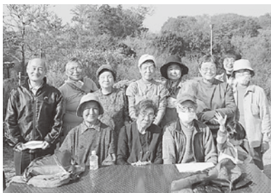
撮影の時だけマスクを外しました

11月18日(水)すがすがしい天気にも恵まれ、バス・車と分散し、アンデルセン公園に向かいました。園内は平日のために入場者はそれ程多くは有りませんでした。皆さん年齢を感じさせない若々しさがあ