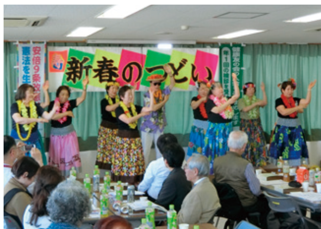
保健委員有志によるハワイアン

いただきました。鎌ヶ谷診療所健康友の会、千葉健生病院健康友の会、船橋西二和グリーンハイッ自治会会長がご来賓として参加。2部は恒例のお楽しみ会。最初に櫻蕉会の3名の名取のみなさんが鶴亀など