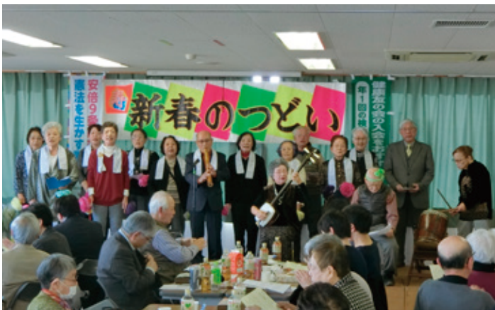
民謡愛好会のみなさん